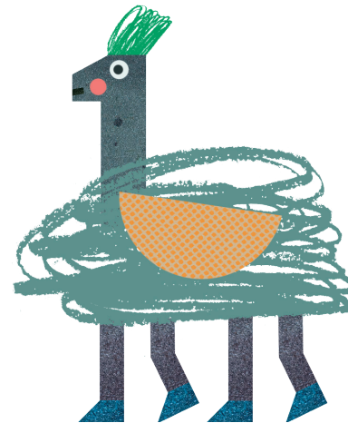
Gryzmak wygląda tak

• W kosmosie pana Lema, który napisał „Bajki robotów”, jest dużo tajemniczych i dziwnych rzeczy oraz stworzeń: murkwie, kambuzele, gryzmaki, pćmy... My narysowaliśmy gryzmaka, a jak wygląda reszta?